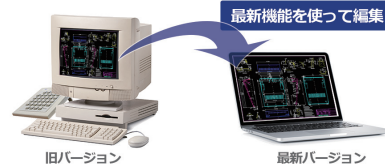
旧バージョンで作成した図面を最新リリースで呼び出し最新の機能を使って編集できます

いつでも再利用可能なため、膨大な図面資産を埋もれたままにせず、流用設計に有効に活用いただけます。