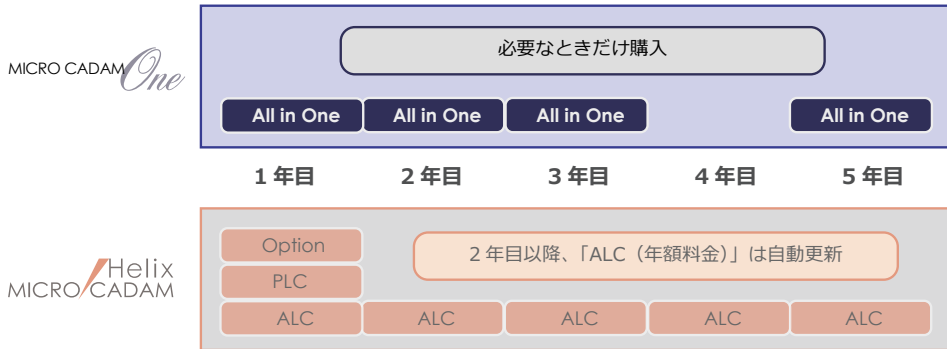
MICRO CADAM One と MICRO CADAM Helix の比較

ライセンスをご購入いただく方式の MICRO CADAM Helix (PLC/ALC 版) もあります。機能的な違いはありません。お客様のご利用本数や用途 / 期間に合わせてお選びください。